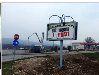
Film Festival della Lessinia: Madre Terra minacciata dalle azioni dell'uomo