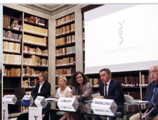
Dal Film Festival della Lessinia uno sguardo verso il pianeta Terra