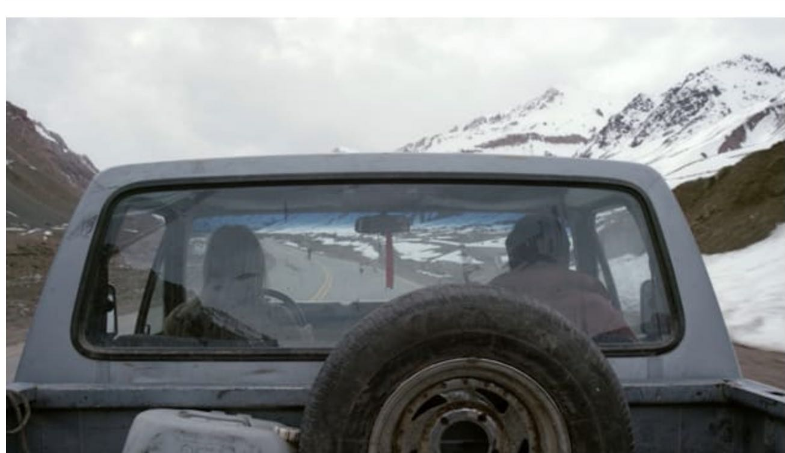
frame dal film "Al silenzio"

5 < Condivisioni [Facebook] [Twitter] [Telegram] [Email]