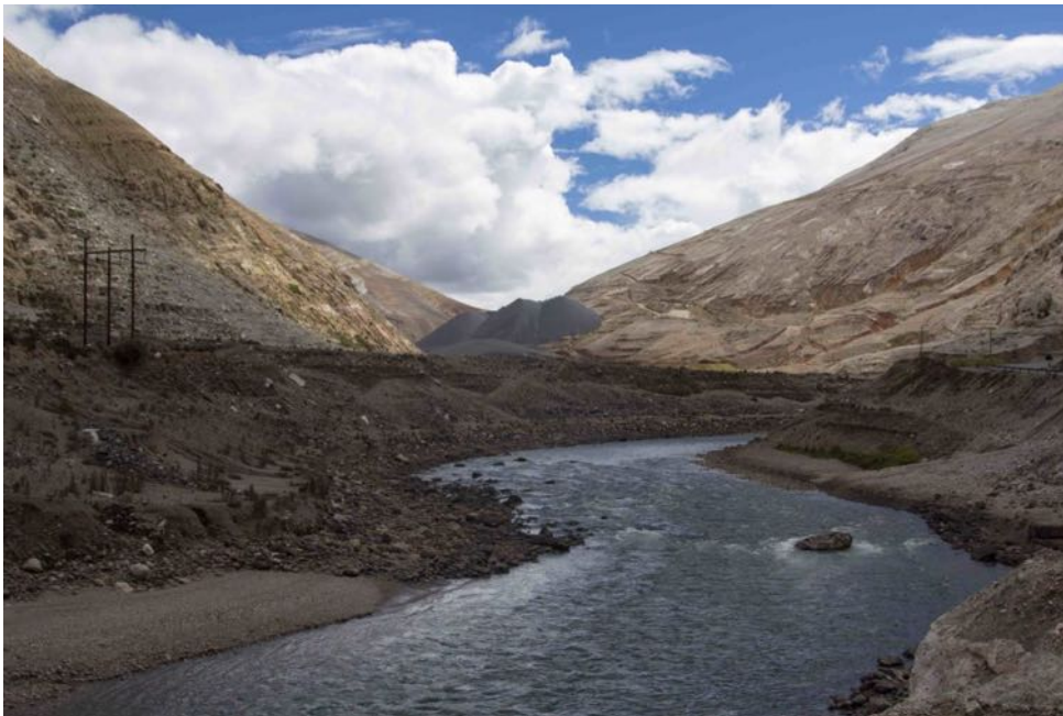
Jardines de Plomo

Immaneabile lo spazio riservato nella Piazza del Festival, con bar e tavola calda, all'enogastronomia con i prodotti tipici del territorio: dai formaggi DOP della montagna veronese del Consorzio Monte Veronese ai vini delle Cantine Bertani.