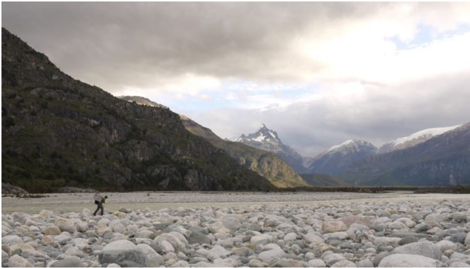
La Ciudad Perdida