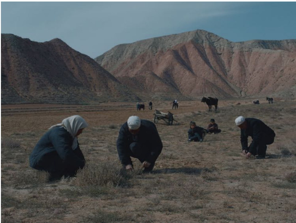
Qingshuili de daozi

L'apertura del Festival è affidata a una produzione portoghese e brasiliana, Vazante di Daniela Thomas. Dagli schermi della Berlinale arriva a Bosco Chiesanuova, in anteprima italiana, la storia ambientata in Brasile a inizio Ottocento, negli anni che precedono l'abolizione della schiavitù. È un film potente e cupo, anche per scelta della fotografia in bianco e nero e dialoghi rarefatti.