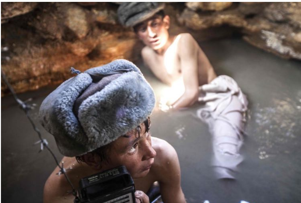
The Land of the Enlightened