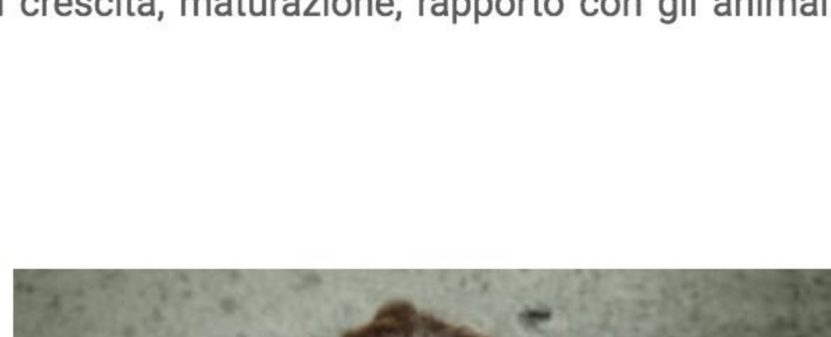
Das Maedchen – Film Festival della Lessinia 2017 ©

Il Film Festival della Lessinia ospita tradizionalmente una retrospettiva che indaga su temi e figure storiche della vita nelle terre alte. Riporta dei banditi sulle montagne italiane il convegno organizzato (il 20 agosto) dal Curatorium Cimbricum Veronese che ha tra gli ospiti l'antropologo Annibale Salsa . La retrospettiva tematica punta su quattro titoli da cineteca: Banditi ad Orgosolo di Vittorio De Seta, Salvatore Giuliano di Francesco Rosi, il brigante di Tacca del Lupo di Pietro Germi, Il passatore di Duilio Coletti. Un fatto di banditi contemporanei è invece quello di Gianluigi Toccafondo nel breve film sperimentale di animazione Briganti senza gloria.