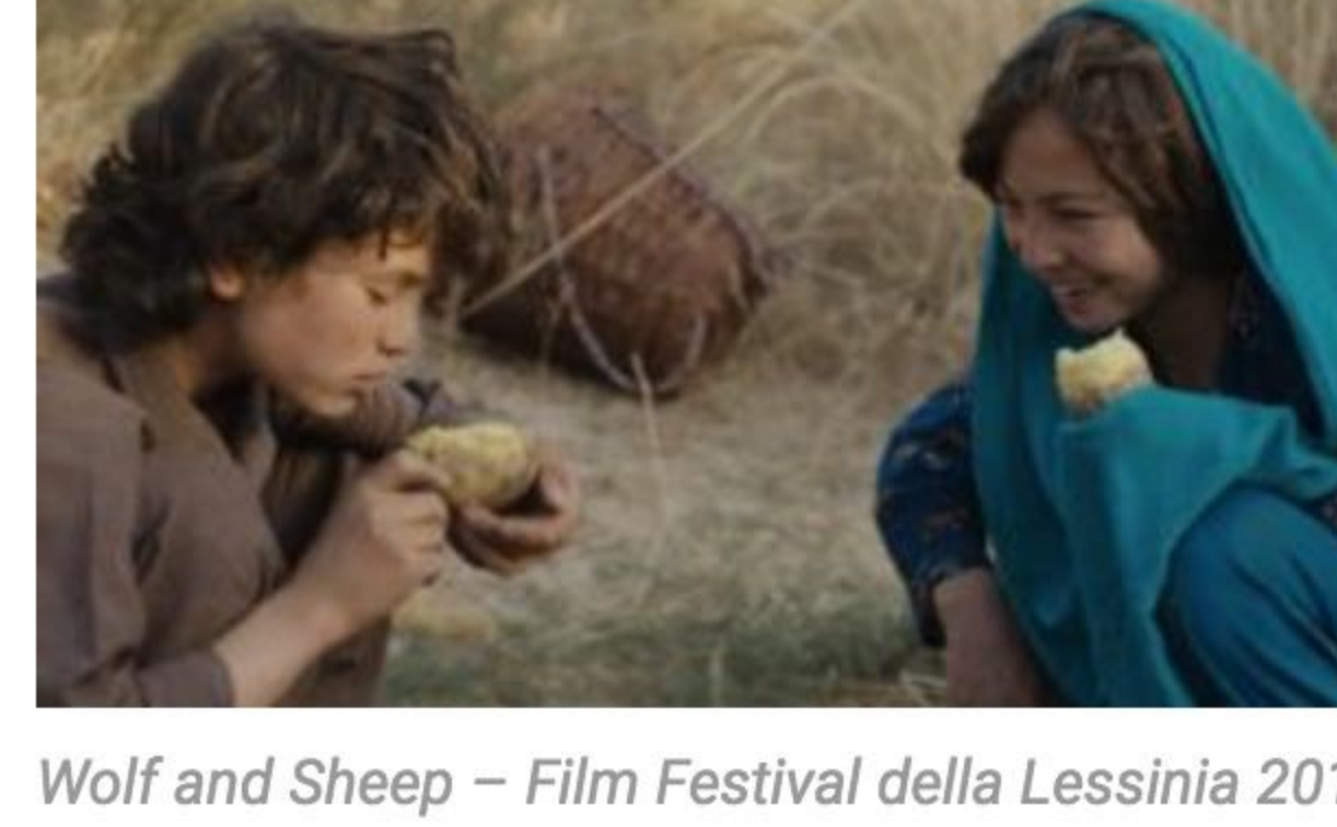
Wolf and Sheep – Film Festival della Lessinia 2017

Dal 19 al 27 agosto, a Bosco Chiesanuova , si riaccende il grande schermo della ventitreesima edizione del Film Festival della Lessinia. Viaggio nella vita, storia e tradizioni delle terre alte e lontane di 31 Paesi del mondo. Nove giorni di proiezioni, con 56 film in programma (di cui 21 in Concorso e altrettanti in anteprima italiana), una retrospettiva su briganti, contrabbandieri e passatori. Numerosi eventi speciali con ospiti attesi: dal regista Alessandro Comodin all'autore Maurizio Maggiani, dall'antropologo Annibale Salsa allo scrittore Paolo Rumiz