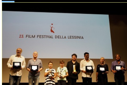
La premiazione del Film Festival della Lessinia 2017

Vola in Afghanistan nei luoghi martoriati dalla guerra la Lessinia d'Oro , il massimo riconoscimento del Film Festival della Lessinia . La rassegna cinematografica dedicata a vita, storia, tradizioni nelle terre lontane si è conclusa sabato 26 agosto 2017 al Teatro Vittoria di Bosco Chiesanuova (Verona) con la premiazione del lungometraggio "Wolf and sheep – Il lupo e le pecore" (Afghanistan, Danimarca, Francia 2016) della regista e sceneggiatrice afgana Shahrbanoo Sadat. Questa la motivazione data dalla giuria internazionale al miglior film in assoluto in competizione alla ventitreesima edizione del Festival scaligero: "Il film crea un quadro complesso, emozionante e a volte buffo della