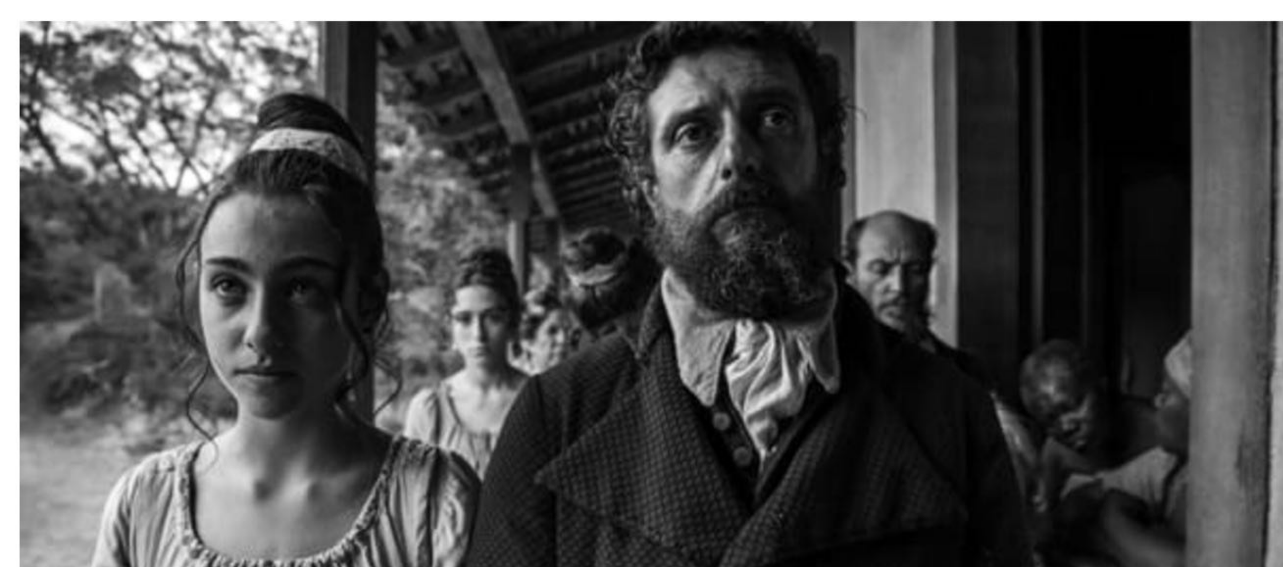
frame dal film "Vazante" in anteprima al Film Festival della Lessinia 23^ edizione

Un'anteprima italiana inaugura sabato 19 agosto la ventitreesima edizione del Film Festival della Lessinia. La rassegna cinematografica internazionale in programma a Bosco Chiesanuova fino al 27 agosto , alle 18, illumina il grande schermo del Teatro Vittoria su una storia ambientata nel 1821, in Brasile, tra le montagne della Diamantina. Si tratta di "Vazante" (Brasile, Portogallo 2017), presentato alla Berlinale e in Lessinia per la prima volta in Italia. È uno dei 56 film, provenienti da 31 Paesi, in cartellone quest'anno alla manifestazione veronese di cui è direttore artistico Alessandro Anderloni .