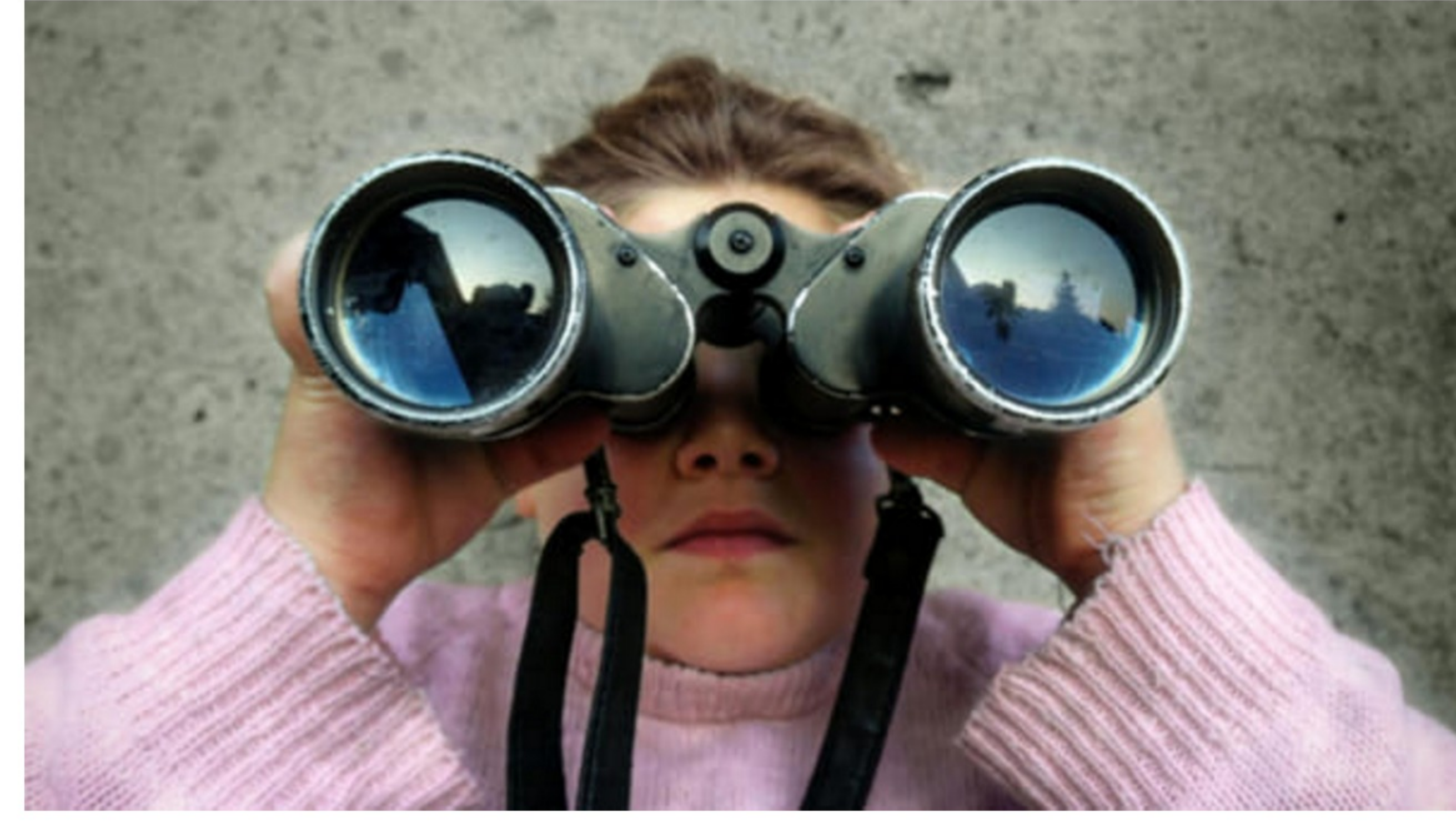
Film Festival della Lessinia 2017, "Das Madchen"

Banditi, contrabbandieri, pastori. Sarà l'anno dei "fuorilegge" quello della ventitreesima edizione del Film Festival della Lessinia . E non solo, perché la rassegna cinematografica internazionale in programma a Bosco Chiesanuova (Verona) dal 19 al 27 agosto offre uno sguardo ampio sulla contemporaneità del vivere sulle terre alte. È la montagna come teatro in cui hanno luogo storie di sopravvivenza e morte, di fuga ed emigrazione, di guerre e persecuzioni, di attraversamento dei confini geografici e socio-politici, di scoperta ed esplorazione.