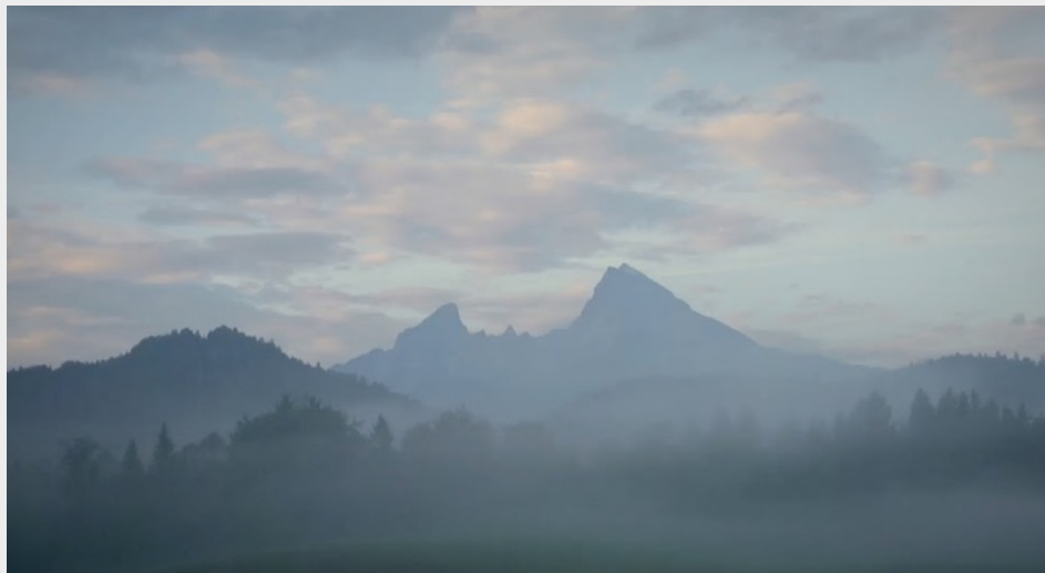
Cafè Valdluft – Still2.

ricercati nella produzione internazionale, che affrontano i temi delle terre alte per presentarli al pubblico più giovane. Ormai un “festival nel festival” con anteprime italiane altrimenti impossibili da ritrovare. Alla programmazione in sala si affianca un’interessante proposta di laboratori didattici, utili a far sperimentare materiali e a riflettere sulle problematiche ambientali.